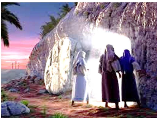
Femmes au tombeau

Le Christ nous a montré la résurrection, aujourd'hui l'humanité s'élève vers cette conscience ; de nombreux sages, ermites, vivants ou dans leur corps d'immortels viennent nous enseigner sur cette grande évolution, c'est une chance extraordinaire que nous avons aujourd'hui de pouvoir en bénéficier.