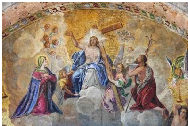
Mosaïque de la Basilique Saint-Marc représentant l'ascension du Christ

Notre dernier expir en conscience réalise notre Union avec la pure Lumière Divine