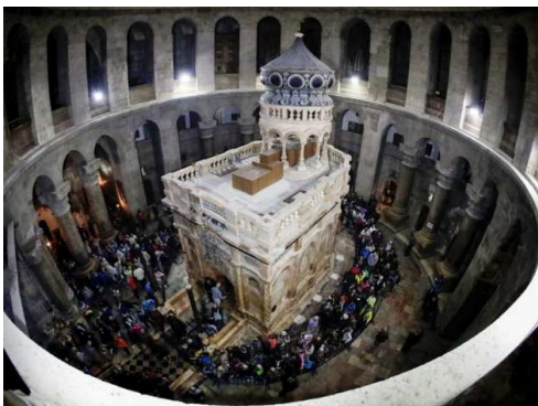
Le tombeau du Christ au Saint Sépulcre

A Jérusalem, Jésus a transformé son corps en un corps de lumière et il a fait plus encore .Le Saint Sépulcre est le lieu qui témoigne et rayonne de ce moment grandiose dans l'histoire de l'humanité.