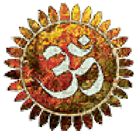
La roue du dharma

Lorsqu'on considère tous les êtres à travers son propre Atman, et son propre Atman à travers tous les êtres, on s'est identifié à Brahman. (Annapurna Upanishad)