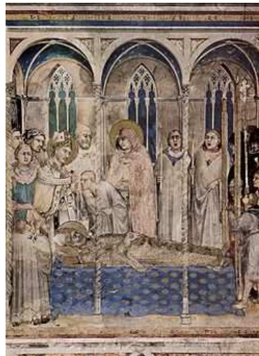
La mort de Saint Martin entouré de ses disciples